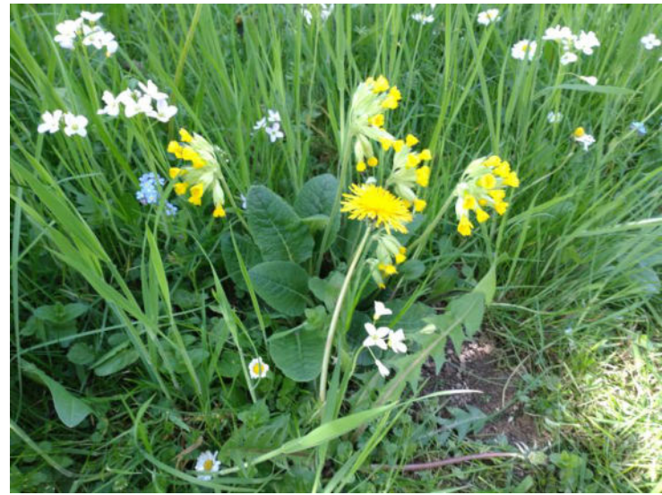
Schlüsselblume, Wiesenschaumkraut, Löwenzahn

Von Scharbockskraut, Huflattich und Lungenkraut im frühen Frühjahr bis im Sommer dann die Margerite und die Wilde Möhre blüht können Sie sich an der Artenvielfalt erfreuen.