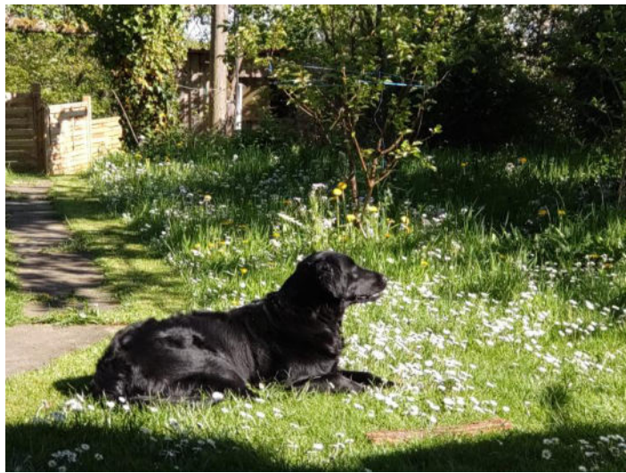
Auch Leika fühlt sich wohl im Blütenmeer

Nehmen Sie sich die Zeit einfach entspannt zu beobachten, was sich dort tut.